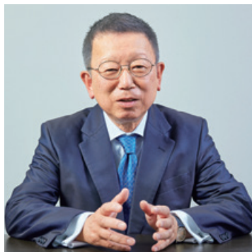
代表取締役会長 兼 社長